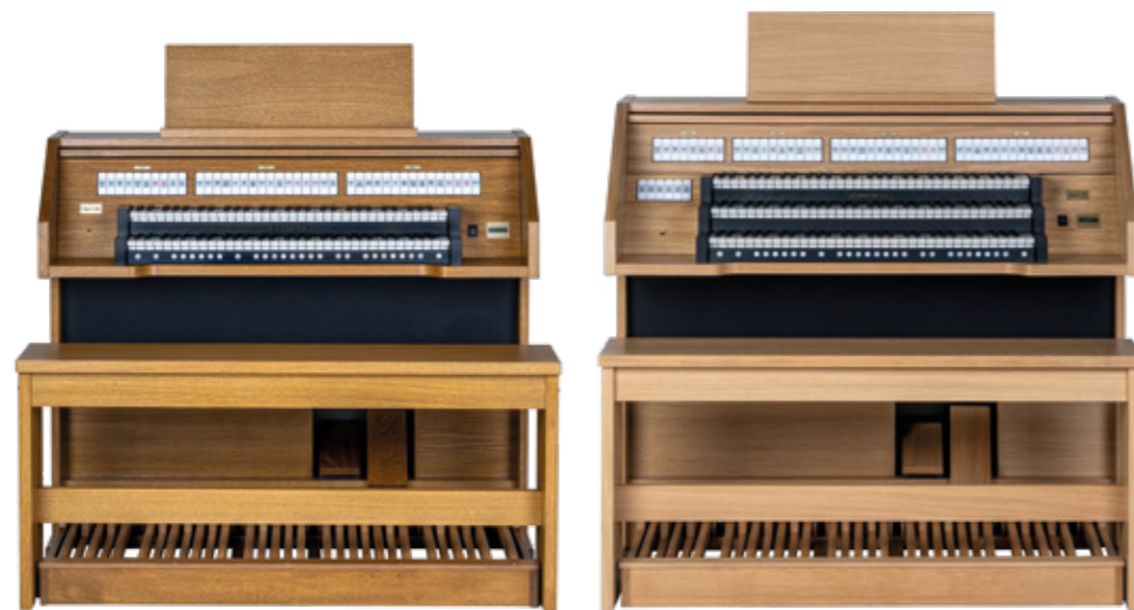
De Opus C-260 De Opus C-260 brengt stemmen samen

De Opus C-260 is met zijn twee klavieren en 36 registers uitermate geschikt om zang te begeleiden. Het subtiele en elegante instrument is exclusief gebouwd voor kleinere ruimtes tot ongeveer 150 personen. Door de authentieke pijporgelklank van het orgel wordt de gehele ruimte in beroering gebracht.