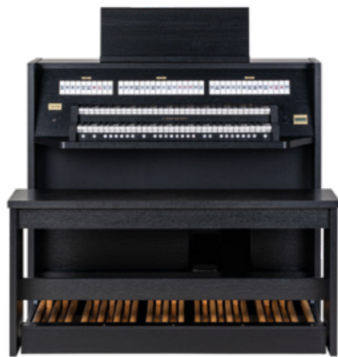
De Opus 260 De Opus 260 zet altijd de juiste toon

De Opus 260 beschikt over een stijlvariabele dispositie van 36 stemmen. Deze stemmen, verdeeld over vier orgelstijlen, zijn allemaal afkomstig van de pijporgels uit de kerken van Kampen, Amsterdam, Raalte, Parijs en Dresden. Wanneer de organist plaatsneemt achter de Opus 260, schakelt hij moeiteloos over van de ene samplebank en naar de andere. En of er nu muziek van Bach op de lessenaar staat, of van Guilman, de Opus 260 zet altijd de juiste toon.