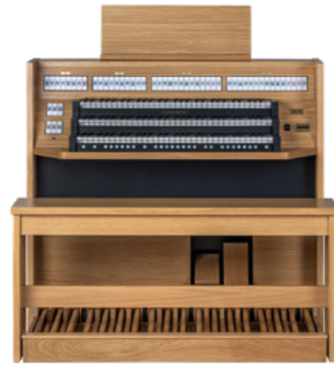
De Opus 360 Een meesterlijk orgel voor iedere organist

De Opus 260 beschikt over een stijlvariabele dispositie van 36 stemmen. Deze stemmen, verdeeld over vier orgelstijlen, zijn allemaal afkomstig van de pijporgels uit de kerken van Kampen, Amsterdam, Raalte, Parijs en Dresden. Wanneer de organist plaatsneemt achter de Opus 260, schakelt hij moeiteloos over van de ene samplebank en naar de andere. En of er nu muziek van Bach op de lessenaar staat, of van Guilman, de Opus 260 zet altijd de juiste toon.