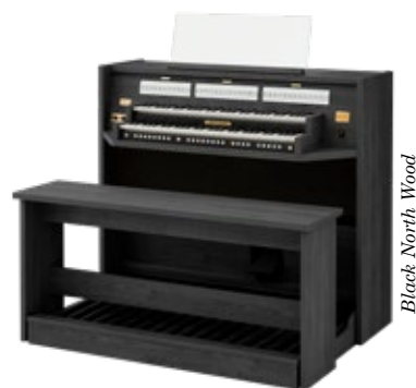
Black North Wood

Avec deux claviers et un pédalier droit plat à 30 touches, le Studio 150 offre un vaste choix de possibilités aux organistes, qu'ils soient débutants ou chevronnés. Il dispose de 28 jeux. Cet instrument prend peu de place grâce à ses dimensions modestes. Le Studio 150 est équipé d'un système audio 2.1 haut de gamme qui permet de faire retentir avec clarté et justesse le son Johannus mondialement célèbre dans tous les coins du salon.