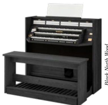
Black North Wood

Avec trois claviers et 37 jeux, le Studio 350 est le grand frère du Studio 150. L'organiste professionnel dispose ainsi avec le Studio 350 d'un orgue d'études idéal dans son propre salon, et l'organiste amateur débutant peut également profiter d'une riche palette de possibilités. Les jeux solo tels que la flûte de pan et la trompette permettent toutes sortes de variations et d'expérimentations pour mieux faire ressortir la mélodie.